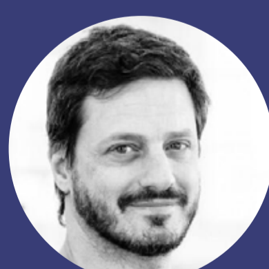
Sebastián Puia Implantología