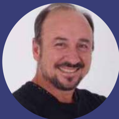
Rodrigo De Nardo Periodoncia