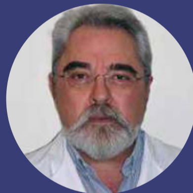
Alfonso Venturelli Cirugía ortognática y patología de ATM